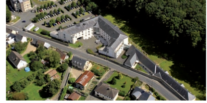
EHPAD Eugène Aujaleu Le Grand Lucé