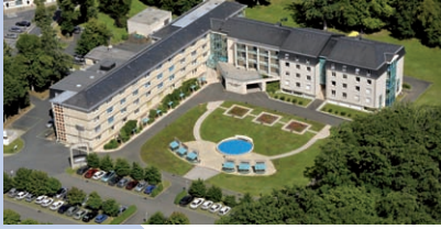
Centre Médical Foyer d'Accueil Médicalisé Service de Soins Infirmiers A Domicile Le Grand Lucé

Le Journal de la Fondation Georges Coulon