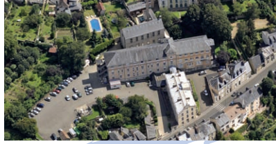
Centre de Soins de Suite Service de Soins Infirmiers A Domicile Le Mans