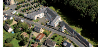
EHPAD Eugène Aujaleu Le Grand Lucé