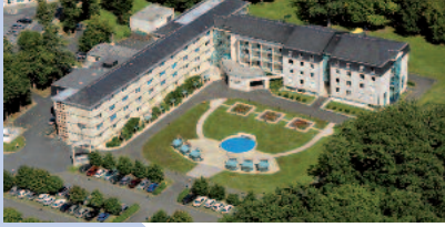
Centre Médical Foyer d'Accueil Médicalisé Service de Soins Infirmiers A Domicile Le Grand Lucé

Le Journal de la Fondation Georges Coulon