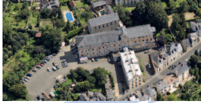
Centre de Soins de Suite Service de Soins Infirmiers A Domicile Le Mans